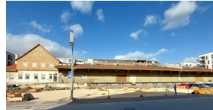
Güterhalle, Eisenbahnstrasse, Alter Güterbahnhof, Tübingen

Mit der Finanzierung des Quartiersraumes ermöglichen wir die Bespielung des Areal und damit das Gesamtkonzept .